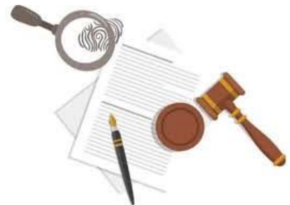
Asegurar mecanismos legales correspondientes