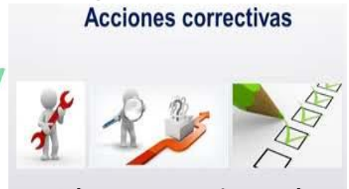
Adecuar mecanismos de acciones correctivas