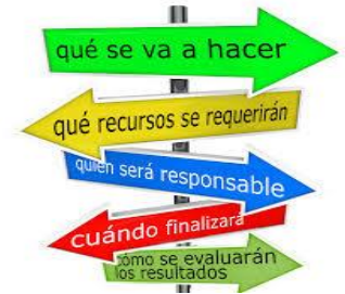
Asegurar adecuada planificación