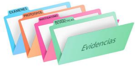
Adecuar métodos recolección evidencias