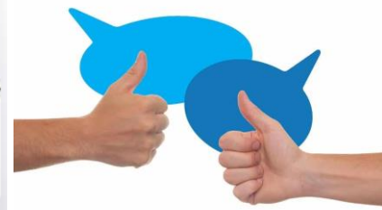
Establecer mecanismos de resolución de conflictos