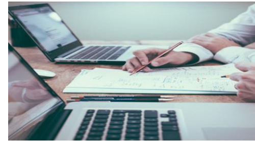
Asegurar que Auditor y Auditado están preparados