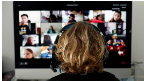
Más que teleconferencias

Oficina Regional para Norteamérica, Centroamérica y Caribe