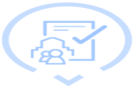
Adecuar mecanismos de cumplimiento